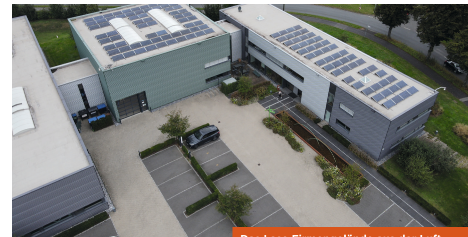
Das Lase Firmengelände aus der Luft

Weitere Informationen gibt es auf lase-karriere.de