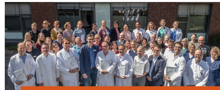
Das Team des Niederrheinischen Zentrums für Tumorerkrankungen

Das Niederrheinische Zentrum für Tumorerkrankungen am Marien-Hospital wurde erstmals als Onkologisches Zentrum durch die Deutsche Krebsgesellschaft zertifiziert.