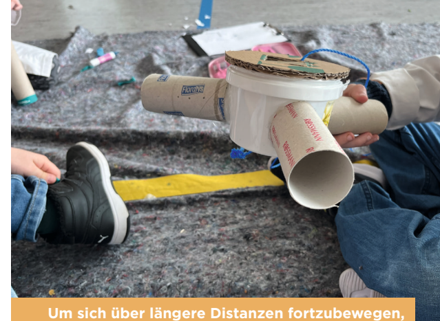
Um sich über längere Distanzen fortzubewegen, entwickelte diese Forschergruppe eine Drohne

Umgesetzt wurde die Forscherwoche in diesem Jahr wieder in enger Zusammenarbeit mit der Gemein-