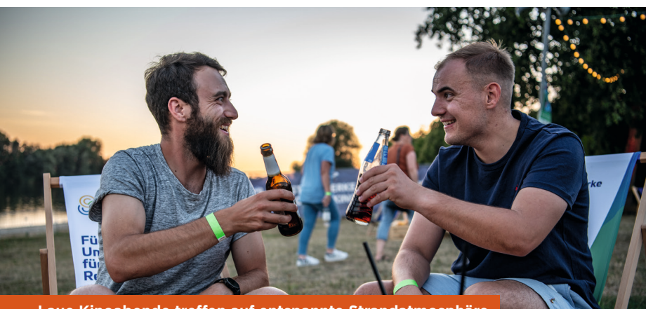
Laue Kinoabende treffen auf entspannte Strandatmosphäre

Das Stadtwerke Sommerkino hat sich mittlerweile zu einer festen Veranstaltungsgröße im Weseler Veranstaltungskalender etabliert. Die von WeselMarketing in Kooperation mit dem Comet Cine Center Wesel organisierte Veranstaltung lädt ins Weseler Wohnzimmer am Auesee ein. Die sommerlichen Kinoabende mit Strand-Feeling werden durch die Unterstützung der Stadtwerke Wesel und Hülskens ermöglicht.