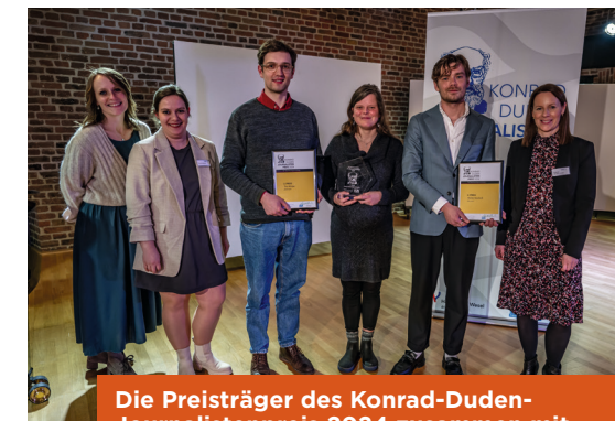
Die Preisträger des Konrad-Duden-Journalistenpreis 2024 zusammen mit dem Team von WeselMarketing

Alle weiteren Informationen zum Konrad-Duden-Journalistenpreis gibt es auf wesel-tourismus.de