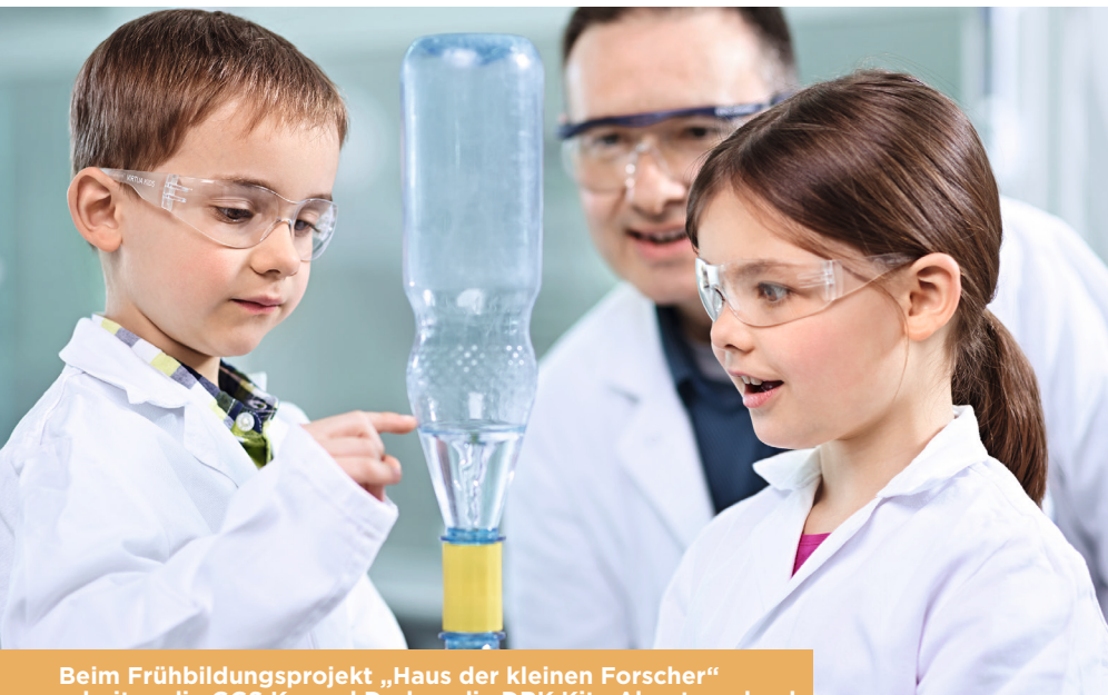
Beim Frühbildungsprojekt „Haus der kleinen Forscher“ arbeiten die GGS Konrad Duden, die DRK Kita Abenteuerland und BYK in Wesel bereits seit 2011 erfolgreich zusammen

Naturphänomene sind spannend – und machen neugierig. Wie verbreitet sich Schall? Und was muss ich tun, damit ein Turm stabil steht? Zwei von unzähligen Fragestellungen, denen Grundschul- und Kita-Kinder beim „Haus der kleinen Forscher“ in Wesel gemeinsam mit den Schulbotschaftern und -botschafterinnen von BYK, einem Geschäftsbereich der ALTANA AG, in Experimenten nachgegangen sind. Dabei sind einige bemerkenswerte Ergebnisse entstanden.