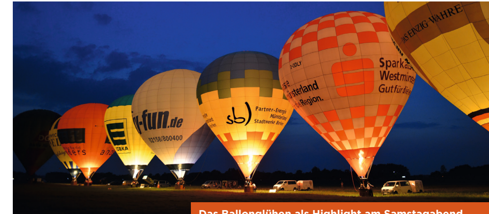
Das Ballonglühen als Highlight am Samstagabend

Am Sonntag verwandelt sich die Fischtorstraße in das Paradies für Schnäppchenjäger und Trödelmarkt-Fans. Mit rund 200 Ständen gehört der Trödelmarkt zu den größten am Niederrhein und lädt zum Durchstöbern von alten und neuen Schätzen ein. Der Flugplatz Römerwardt wird zum Stadtfest eine Spielwiese für Groß und Klein. Mit Rundflügen in verschiedenen