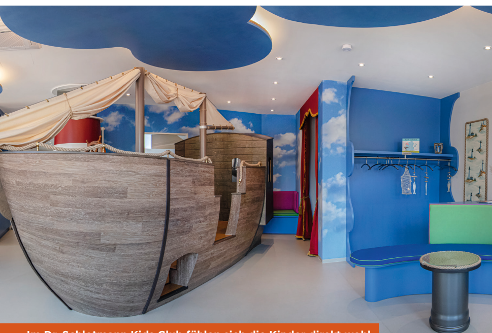
Im Dr. Schlotmann Kids Club fühlen sich die Kinder direkt wohl

0281 1479820 Dr. Schlotmann Kids Club am Berliner-Tor-Platz 8 in Wesel