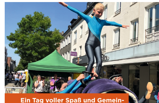
Ein Tag voller Spaß und Gemeinschaft beim Vereinsfest in Wesel