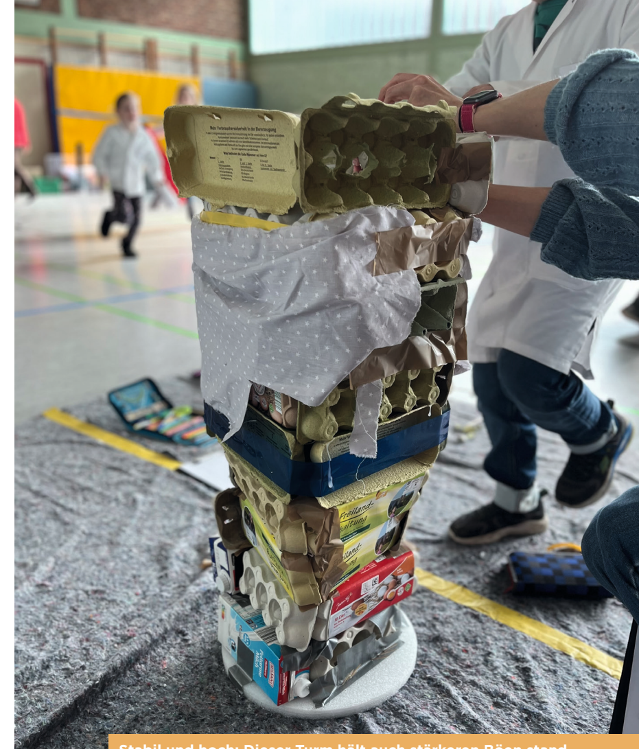
Stabil und hoch: Dieser Turm hält auch stärkeren Böen stand

Die GGS Konrad Duden, die DRK Kita Abenteuerland und BYK in Wesel arbeiten bereits seit 2011 bei diesem Frühbildungsprojekt erfolgreich zusammen. Sie sind Netzwerkpartner der Stiftung „Haus der kleinen Forscher“ mit Sitz in Berlin. Die Stiftung will das Interesse von Grundschul- und Kita-Kindern an naturwissenschaftlichen Zusammenhängen wecken und eröffnet ihnen dazu bereits frühzeitig alltägliche Begegnungsmöglichkeiten mit Mathematik, Informatik, Naturwissenschaften und Technik. Das Bundesministerium für Bildung und Forschung fördert die Initiative für frühe Bildung in Deutschland bereits seit dem Jahr 2008.