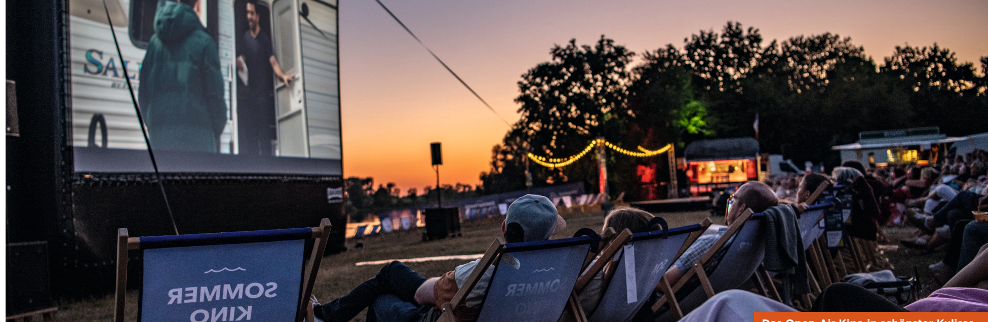
Das Open-Air Kino in schönster Kulisse

Für das leibliche Wohl sorgt „Taste it toto“ mit seinem Streetfood Wagen. Es werden eigene Burger-Kreationen, Pommes und weitere Leckereien angeboten. Am Stand vom Kino gibt es standesgemäß Popcorn, Nachos, Eis und kalte Getränke. So lässt sich die Wartezeit am loungigen Strandbereich perfekt überbrücken.